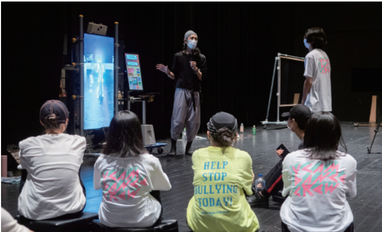
「メディア・テクノロジーでダンスをパワーアップするワークショップ」(2023年)

ダンスや演劇などのパフォーマンス作品の上演は、展覧会や映画上映と並ぶYCAMの活動の柱です。開館以来、国内外の優れた作品を紹介するとともに、アーティストとのコラボレーションを通じてメディア・テクノロジーの発展によってもたらされる身体表現の進化に注目しながら、新作の制作をおこなってきました。