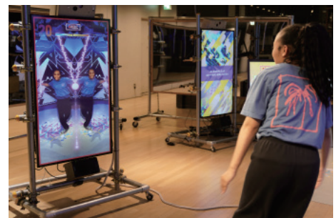
音楽に合わせてダンスしながらエフェクトを選択する。納得のいくダンスができれば録画する