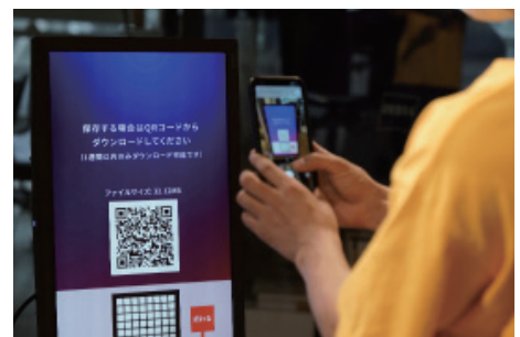
完成した映像をスマートフォンにダウンロードして、SNSでシェアする