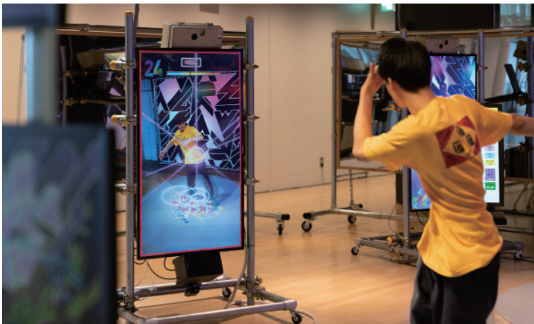
YCAM Dance Crewで開発した体験型ダンスブース (2021年)

本イベントでは、2021年に好評を得た体験型のダンスブースを再展示するとともに会期中盤の7月19日からはAI技術を使った新しいダンスブースを公開します。