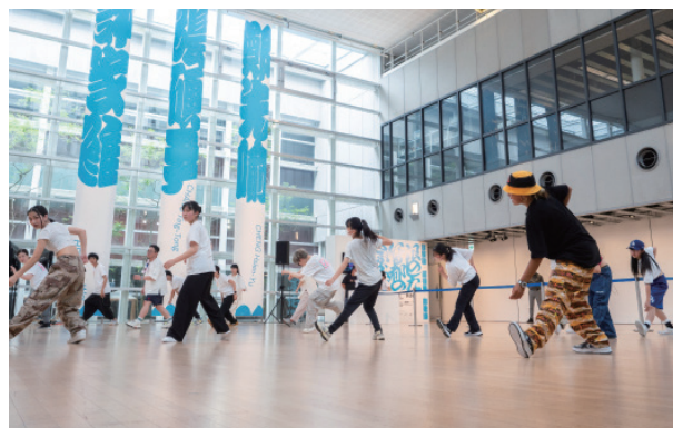
「メディア・テクノロジーでダンスをパワーアップするワークショップ」(2023年)

この機会に、取材や記事掲載にご協力いただけますよう、よろしくお願い申し上げます。