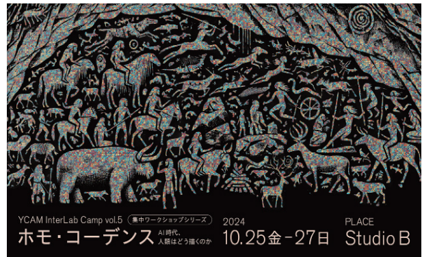
イベントのメインビジュアル (Illustrated by Takawo Shunsuke with AI (DALL-E 3) Designed by Akari Sakamoto

※ ホモ・コーデンス：コンピュータに対して命令を与えるためのコードを用いて創造的な表現を行う人間の姿を表した造語