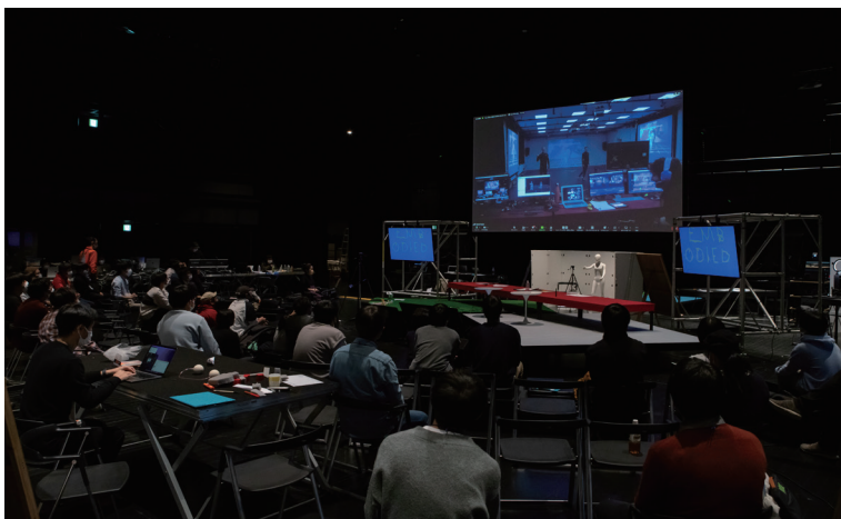
「YCAM InterLab Camp vol.4 遠隔・身体・共創」開催の様子 (2022年)

近年のAI領域における技術の進化と実用化は、私たちの生活に大きな影響を与えています。